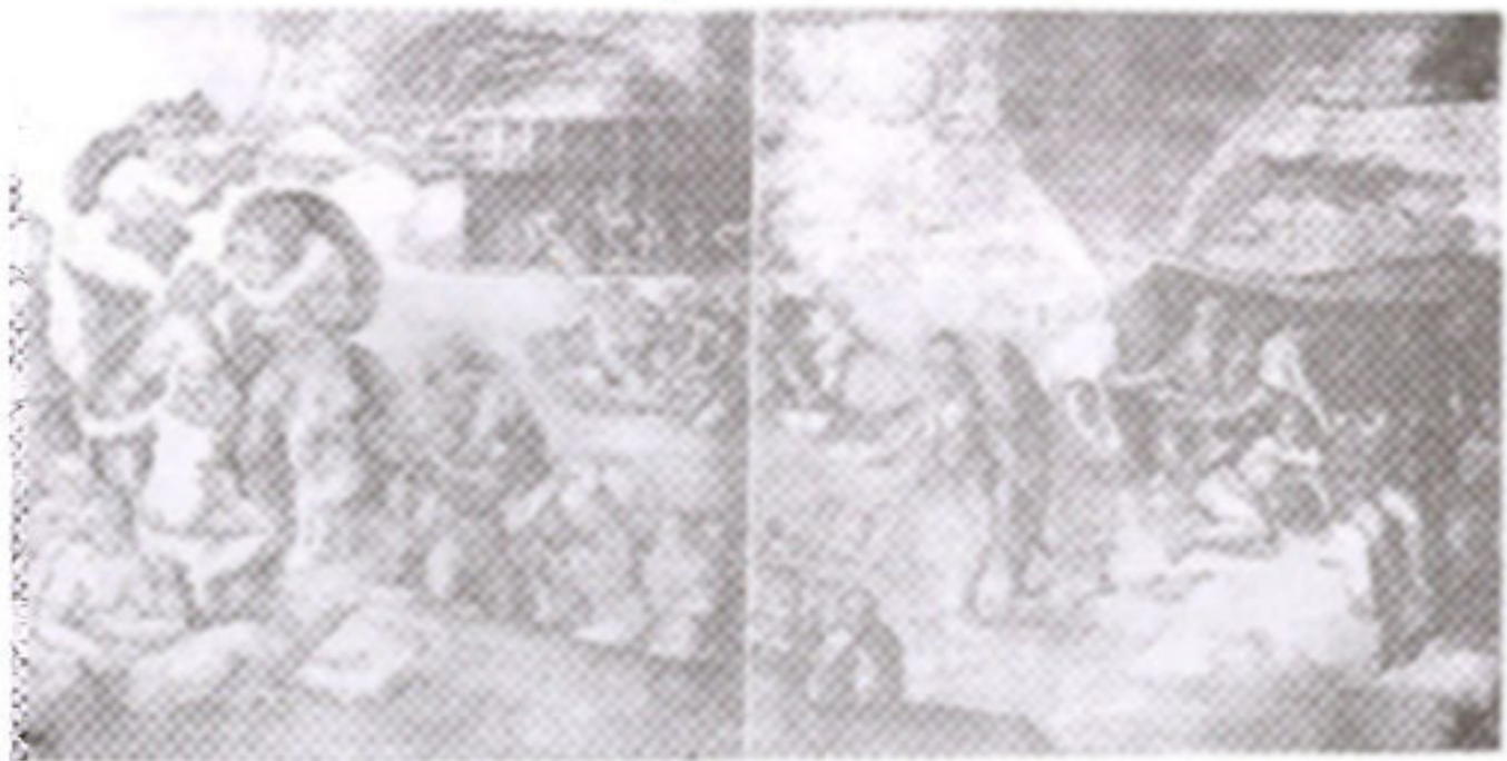
ภาพที่ 22 ภาพ "เหตุการณ์วันน้ำท่วมโลก"