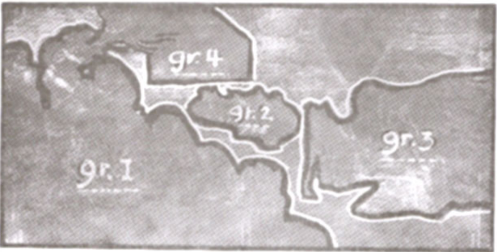
ภาพที่ 27 แสดงกลุ่มคนและเหตุการณ์ในภาพ

เป็นส่วนของฉากหลัง (Back Ground) เป็นนาваของโนอาห์ (Ank) ปรากฏกลุ่มของผู้อพยพจำนวนหนึ่งกำลังที่จะปีนขึ้นบนทาบเรือ แต่เขาไม่สามารถที่จะเข้าไปในนาวาของโนอาห์ได้