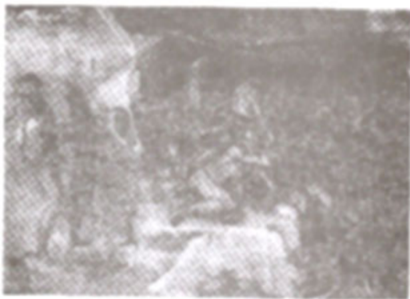
ภาพที่ 25 กลุ่มคนกลุ่มที่ 3

เป็นภาพกลุ่มคนที่ตรงบริเวณกลางภาพ ที่นั้นจะปรากฏกลุ่มคนอีกกลุ่มหนึ่งที่มีความหวังว่าจะหนีภัยน้ำท่วมครั้งนี้โดยอาศัยเรือ (Boat) จะพบว่าเรือลำนั้นมีผู้อพยพอยู่เต็มเรือ และมีน้ำท่วมเข้าไปในเรือส่วนหนึ่งแล้ว เพราะเรือต้องรับน้ำหนักมากเกินไป (Overload) และเพราะว่าเรือลำนั้นต้องได้กับคลื่นลมที่แรงจัด ผู้อพยพที่อยู่ในเรือกำลังทำร้ายซึ่งกันและกันเพื่อเอาตัวรอด เป็นที่แน่นอนว่าเรือลำนั้นจะต้องล่มและทุกคนจะต้องตายอย่างแน่นอน