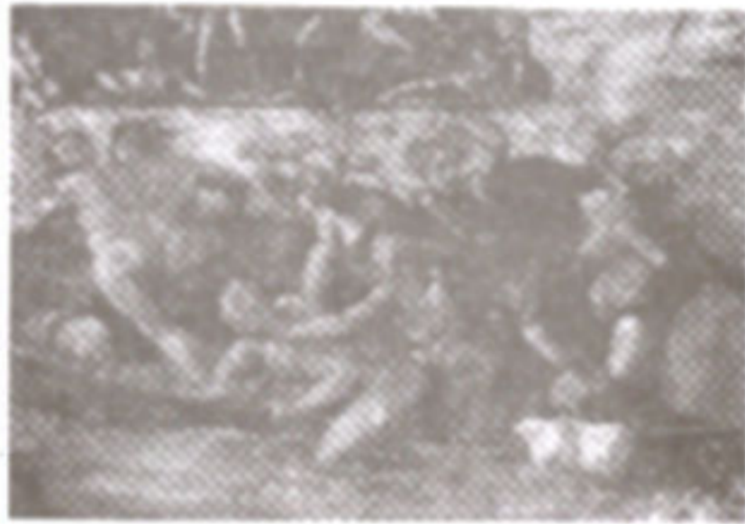
ภาพที่ 24 กลุ่มคนกลุ่มที่ 2

เป็นภาพกลุ่มคนที่ตรงบริเวณกลางภาพ ที่นั้นจะปรากฏกลุ่มคนอีกกลุ่มหนึ่งที่มีความหวังว่าจะหนีภัยน้ำท่วมครั้งนี้โดยอาศัยเรือ (Boat) จะพบว่าเรือลำนั้นมีผู้อพยพอยู่เต็มเรือ และมีน้ำท่วมเข้าไปในเรือส่วนหนึ่งแล้ว เพราะเรือต้องรับน้ำหนักมากเกินไป (Overload) และเพราะว่าเรือลำนั้นต้องได้กับคลื่นลมที่แรงจัด ผู้อพยพที่อยู่ในเรือกำลังทำร้ายซึ่งกันและกันเพื่อเอาตัวรอด เป็นที่แน่นอนว่าเรือลำนั้นจะต้องล่มและทุกคนจะต้องตายอย่างแน่นอน