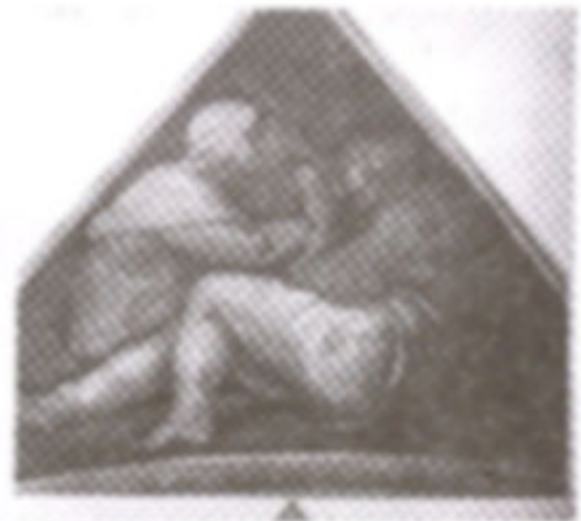
ภาพที่ 8 ภาพตัวอย่างของบรรพบุรุษของพระเยซู