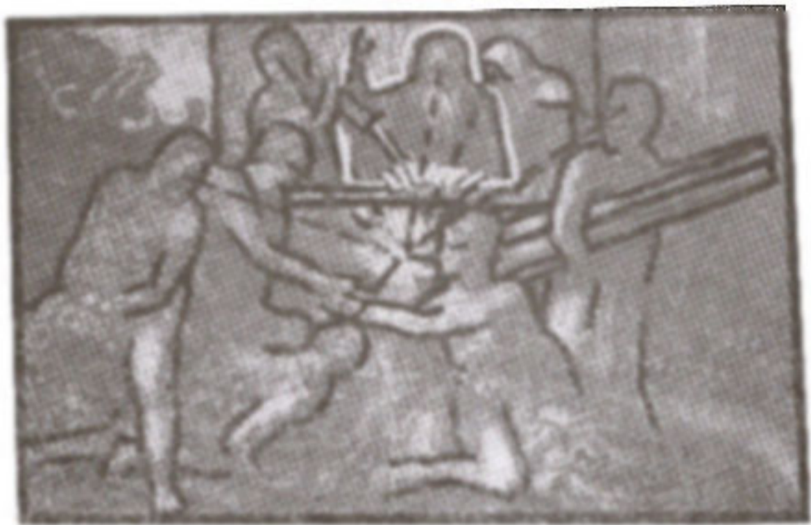
ภาพที่ 29 ภาพแสดงการจัดองค์ประกอบศิลป์

ในภาพโนอาห์จะอยู่ที่แท่นบูชาตรงจุดกลางภาพจุดที่ศิลปินต้องการเน้นคือเหตุการณ์ที่แท่นบูชา เช่น การรวบรวมสัตว์ที่ไร้มลทิน และสัตว์ปีกที่ไร้มลทิน ได้แก่ แกะ วัว และนกเพื่อถวายเป็นเครื่องบูชา มีสภาพสตรีสวมมาลัยบนศีรษะตรงกลางภาพกำลังยื่นนกให้แก่ชายหนุ่มคนหนึ่งในขณะที่เขา และอีกคนหนึ่งนั่งคร่อมร่างของแกะตัวผู้ มีบางคนกำลังจุดไฟที่แท่นบูชา และชายอีกคนหนึ่งกำลังหอบไม้ฟืนไว้ในอ้อมกอดอย่างเอาจริงเอาจัง