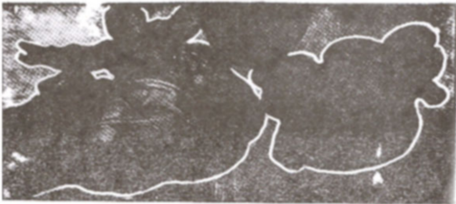
ภาพที่ 13 แสดงการจัดองค์ประกอบศิลป์

ภาพ "การสร้างดวงอาทิตย์และดวงจันทร์" เป็นการเนรมิตโลกของพระเจ้าในวันที่ 3 และวันที่ 4 พระเจ้าได้สร้างดวงสว่างขึ้นมา 2 ดวง คือ ให้ดวงอาทิตย์ซึ่งมีแสงสว่างมากกว่าประจำตอนกลางวัน และพระเจ้าได้สร้างดวงจันทร์ซึ่งมีแสงน้อยกว่าประจำกลางคืน และพระเจ้าได้สร้างดวงดาวต่าง ๆ ด้วย ในภาพจะปรากฏเหตุการณ์ 2 เหตุการณ์ กล่าวคือด้านขวามือของภาพเป็นภาพของพระเจ้ากับทูตสวรรค์องค์เล็ก ๆ ล้อมรอบพระเจ้า โดยพระองค์หันพระพักตร์มาทางตรงกันข้ามกับดวงอาทิตย์และดวงจันทร์ พร้อมทั้งยกมือขึ้นปกป้องแสงสว่างอันเกิดจากดวงสว่างทั้ง 2 ดวงนั้น พระเจ้าทรงกำลังชี้พระหัตถ์ขวา เนรมิตดวงอาทิตย์ และบังเกิดดวงจันทร์ขึ้นทางด้านพระหัตถ์ซ้าย มิเคลันเจโลได้วาดภาพของพระเจ้าผู้ทรงราชอาณาจักรโดยเน้นให้พระพักตร์ของพระเจ้าดูแล้วน่ากลัว (Terrible) และเอาจริงเอาจังด้านซ้ายมือของภาพ เป็นอีกเหตุการณ์หนึ่ง กล่าวคือ เป็นภาพของพระเจ้าที่กำลังเคลื่อนที่ไปในทิศทางตรงกันข้าม นั่นคือ พระเจ้ากำลังเคลื่อนที่ไปยังโลก ซึ่งจะเห็นว่ามิน้ำ มีพืช ผัก หญ้า และต้นไม้ที่ออกผลอุดมสมบูรณ์