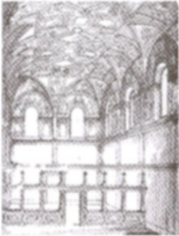
ภาพที่ 3 การออกแบบการใช้พื้นที่