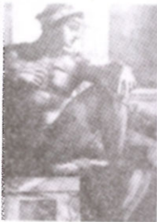
ภาพที่ 7 ภาพตัวอย่างของอิกมุดิ (Igmudi)

3 .บนแต่ละหัวเสาที่แบ่งออกเป็นช่องสี่เหลี่ยม จำนวน 20 เสา ปราบฎภาพของเด็กเปลือย ซึ่งมีชื่อเรียกเฉพาะว่า อิกมุดิ (Igmudi) จำนวน 20 คน