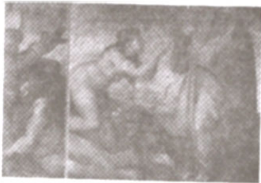
ภาพที่ 18 ภาพ 'การเนรมิตอีฟ'