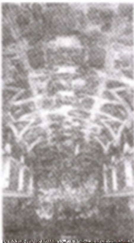
ภาพที่ 5 องค์ประกอบของภาพบนเพดาน