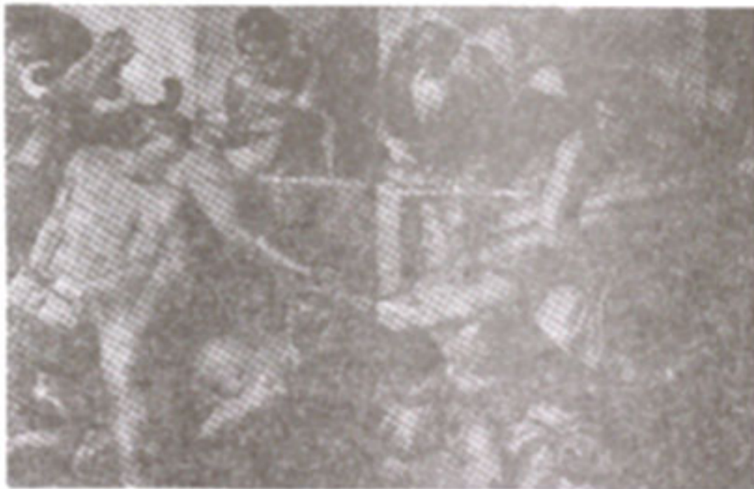
ภาพที่ 28 ภาพ"แท่นบูชาของโนอาห์"