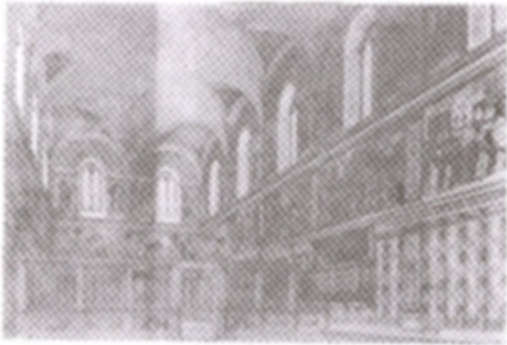
ภาพที่ 1 แสดงสภาพภายในหอสวดมนต์ซีสทีน กรุงวาติกัน

ฝาผนังด้านข้างทั้งสองด้าน มีภาพวาดตกแต่งด้วยจิตรกรรมปูนเปียก โดยจิตรกรฝีมือชั้นครูในศตวรรษที่ 15 ได้แก่ กีย์ลันโคโอ (ครูผู้สอนจิตรกรรมของมิเกลันเจโล) บอดติเชลลี และเปรูจิโน (ครูผู้สอนจิตรกรรมของราฟาเอล)