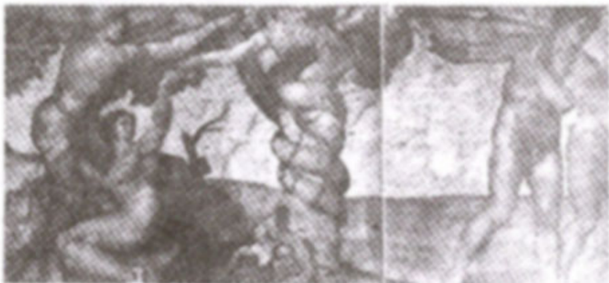
ภาพที่ 20 "การหลงผิดและการถูกขับไล่อ"