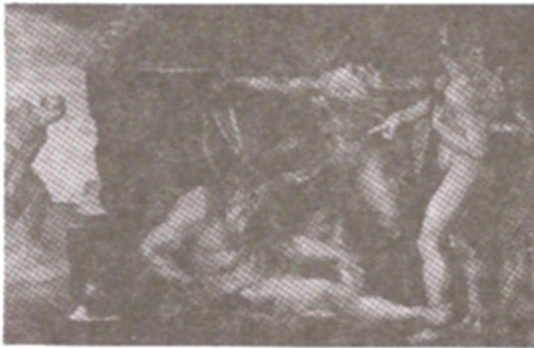
ภาพที่ 30 ภาพ "การเมาเหล้าของโนอาห์"