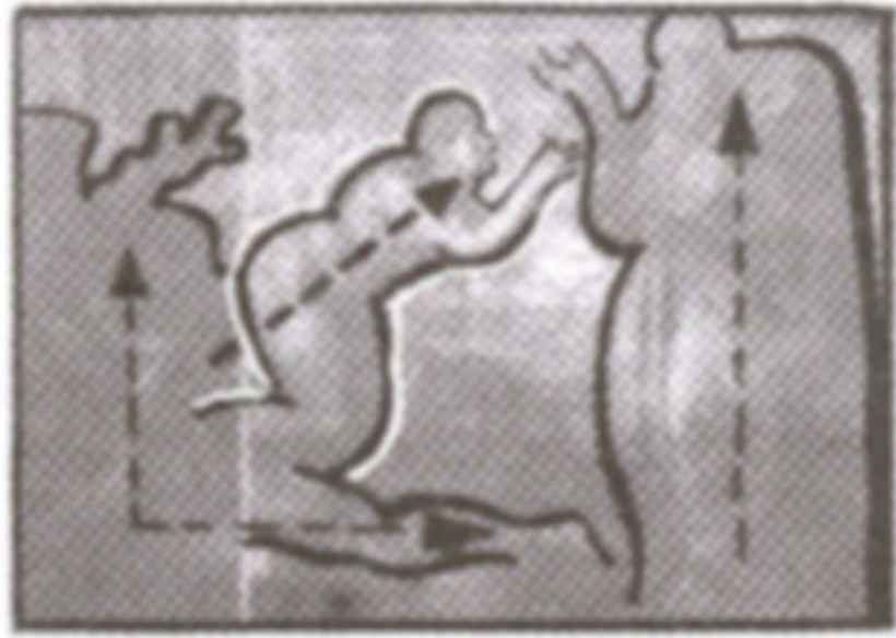
ภาพที่ 19 ภาพแสดงการจัดองค์ประกอบศิลป์

ในขณะที่อีฟกำลังลุกขึ้นและโน้มตัวไปข้างหน้า ยืนแขนขึ้นในลักษณะพนมมือทั้งนี้เพื่อแสดงออกถึงการขอบพระคุณพระเจ้า