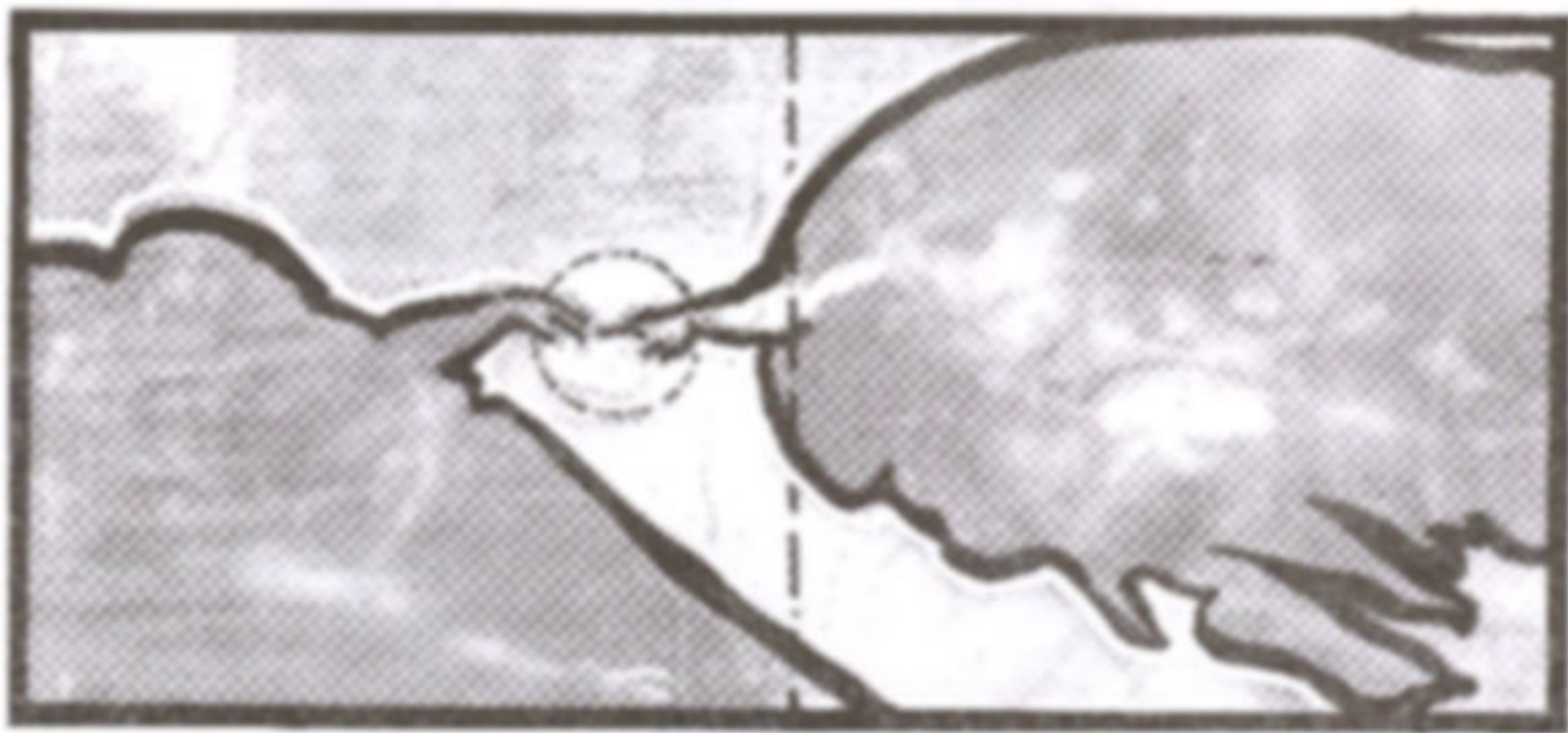
ภาพที่ 17 แสดงการจัดองค์ประกอบศิลป์

ภาพ "การเนรมิตอาดัม" เป็นภาพในช่องที่ 4 ซึ่งเป็นพื้นที่ใหญ่ ช่องกลางของเพดานหอสวนมนต์ซิสทีน และเป็นการเนรมิตสร้างสรรค์ของพระเจ้าในวันที่ 6 ภาพนี้จัดว่าเป็นผลงานชิ้นเอก (Master Piece) ของมิเกลันเจโลซึ่งหนึ่งเขาได้ออกแบบและวาดภาพในช่องนี้เป็นภาพแรกก่อนรูปอื่นใด(ในช่องสี่เหลี่ยมทั้งหมด 9 ช่อง) ภาพ "การเนรมิตอาดัม" เป็นภาพของอาดัมมนุษย์คนแรกของโลก อยู่ในสภาพกึ่งนอนกึ่งนั่ง เปลือยกายมีกิริยาท่าทางเหนื่อยล้า ขันแขนซ้ายเหยียดออกไปข้างหน้า นิ้วชี้ของอาดัมที่ยื่นออกไปเกือบสัมผัสกับพระหัตถ์ของพระเจ้าซึ่งกำลังเหาะผ่านมาพร้อมเหล่าทูตสวรรค์ซึ่งเป็นบริวารในรูปทรงที่เป็นกลุ่มเมฆ (Cloudburst) กำลังจะลอยจากไป นิ้วของอาดัมกับพระเจ้าอยู่ในลักษณะจ่อเข้าหากันเกือบสัมผัสกัน ในช่องว่างระหว่างนิ้วทั้งสอง มีสภาพคล้ายดั่งปรากฏกระแสไฟฟ้ากำลังเกิดปฏิกิริยาอยู่ พระหัตถ์ของพระเจ้าพยายามแตะกับนิ้วของอาดัมเพื่อส่งพลังให้แก่อาดัมเพื่อจะได้มีกำลังที่จะลุกขึ้นและมีชีวิตต่อไป