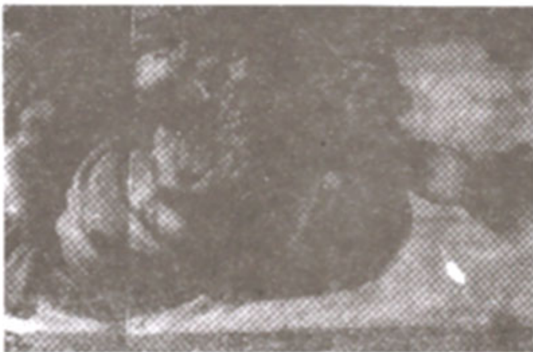
ภาพที่ 14 ภาพ "การแยกท้องฟ้าและน้ำ"