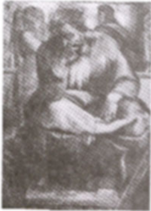
ก. เจริมมอห์

2. ด้านที่ติดกับกำแพงด้านยาวทั้งสองด้าน ตรงหัวและท้ายของเพดาน แบ่งเป็นช่องสี่เหลี่ยม 12 ช่อง บรรจูปภาพของศาสตราจารย์อาทิเช่น โยนาห์ เจริมมอห์ เปร์สคา เอเชคีเอส เอรีเทรฮา โยเอ็ล เซคารีวาร์ เดลฟีคา อีสไซอาห์ กูเมอาร์ คาเนียล และลีบีคา