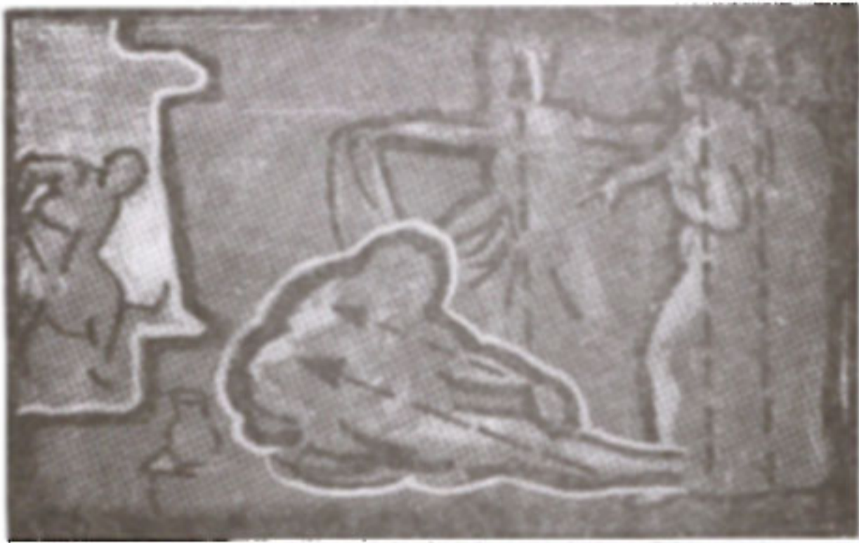
ภาพที่ 31 ภาพแสดงการจัดองค์ประกอบศิลป์