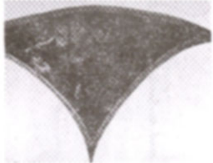
ภาพที่ 9 ก. ภาพคาวิดกำลังต่อสู้กับโกลิแอธ