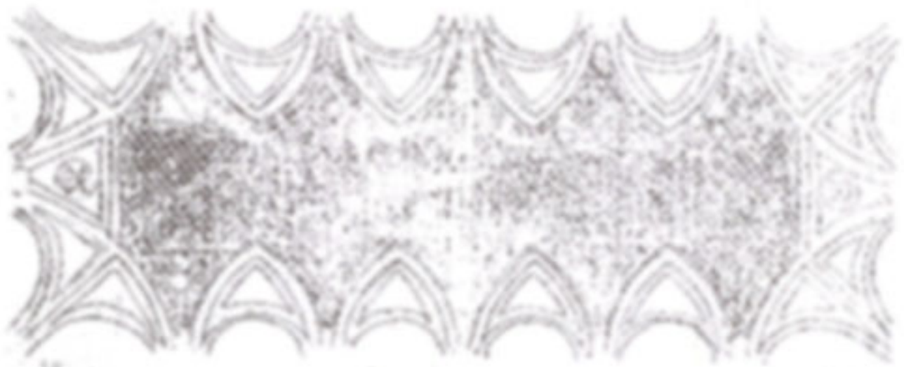
ภาพที่ 2 แสดงผนังของเพดานก่อนวาดภาพจิตรกรรมปูนเปียก

ฝาผนังด้านข้างทั้งสองด้าน มีภาพวาดตกแต่งด้วยจิตรกรรมปูนเปียก โดยจิตรกรฝีมือชั้นครูในศตวรรษที่ 15 ได้แก่ กีย์ลันโคโอ (ครูผู้สอนจิตรกรรมของมิเกลันเจโล) บอดติเชลลี และเปรูจิโน (ครูผู้สอนจิตรกรรมของราฟาเอล)