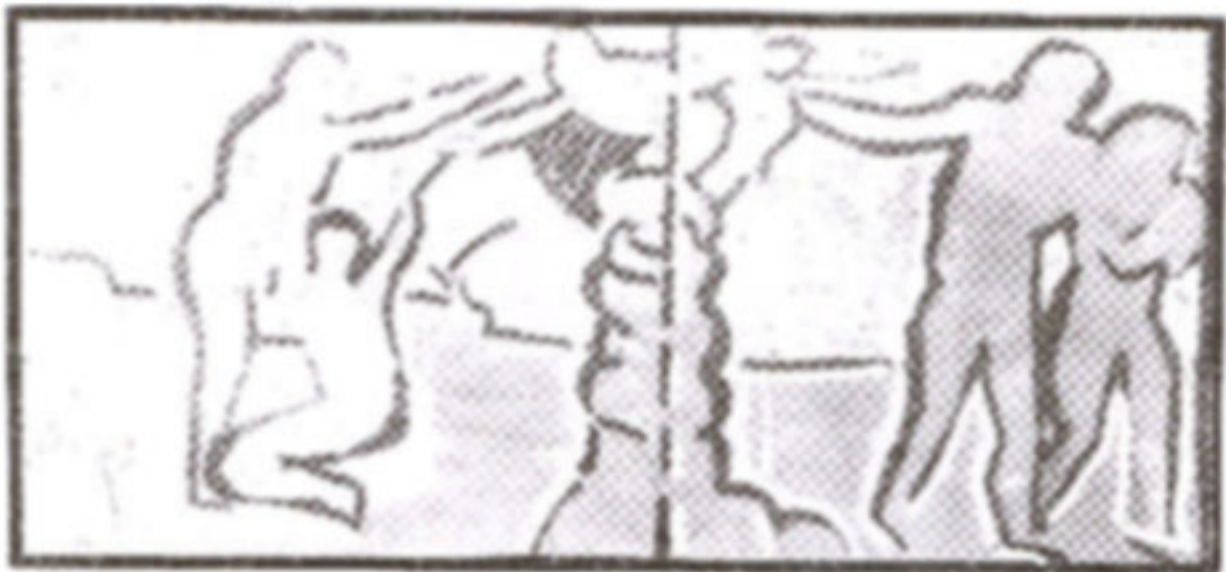
ภาพที่ 21 ภาพแสดงการจัดองค์ประกอบศิลป์

หลังจากที่อีฟและอาดัมรับประทานผลไม้แห่งการรู้ดีชั่วแล้ว จะปรากฏจุดสวรรค์ของพระเจ้า (เฑรุษ) ถืออาวุธ ขับไล่ให้คนบาปทั้งคู่ออกจากสวนเอเดินที่อุดมสมบูรณ์ ออกไปสู่โลกกว้างที่แห้งแล้ง ว่างเปล่า และมีความทุกข์ยากลำบากรอคอยอยู่