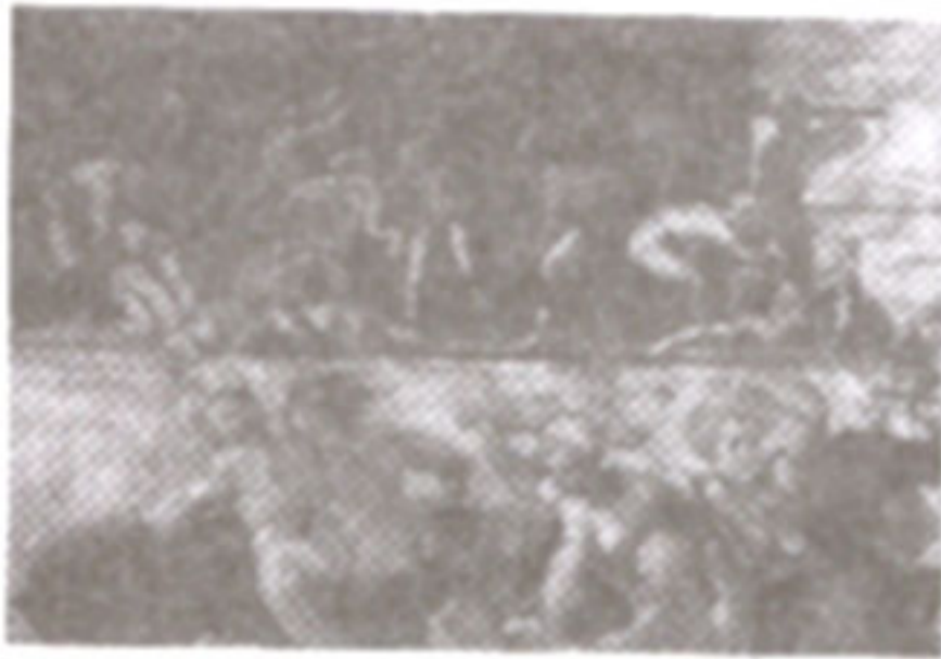
ภาพที่ 26 กลุ่มคนกลุ่มที่ 4

เป็นส่วนของฉากหลัง (Back Ground) เป็นนาваของโนอาห์ (Ank) ปรากฏกลุ่มของผู้อพยพจำนวนหนึ่งกำลังที่จะปีนขึ้นบนทาบเรือ แต่เขาไม่สามารถที่จะเข้าไปในนาวาของโนอาห์ได้