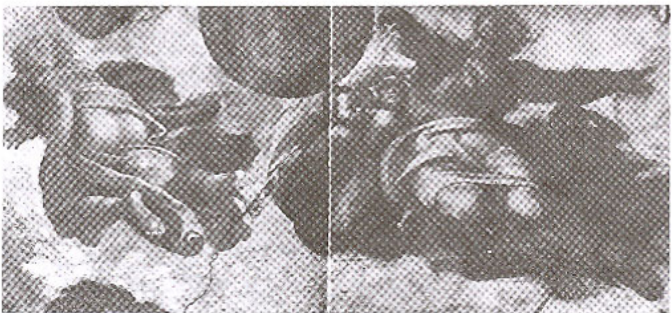
ภาพที่ 12 ภาพ 'การสร้างดวงอาทิตย์และดวงจันทร์'

ช่องที่ 2 "การเนรมิตดวงอาทิตย์และดวงจันทร์" (The Creation of the Sun and Moon)