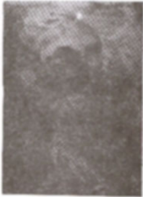
ภาพที่ 10 ภาพ "การแยกความสว่างและความมืด"