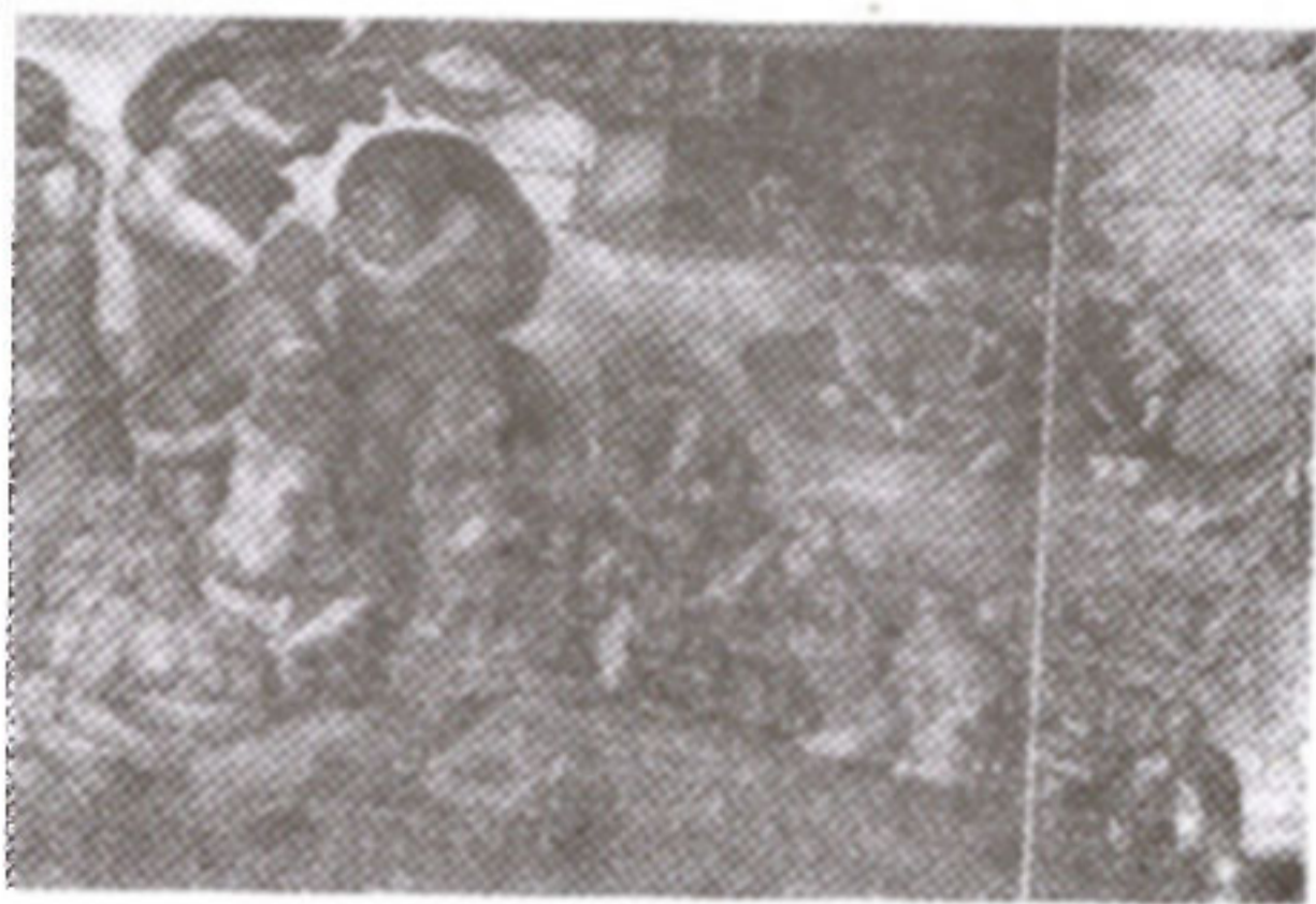
ภาพที่ 23 กลุ่มคนกลุ่มที่ 1

ในภาพนี้เป็นเหตุการณ์ที่แสดงถึงการที่มนุษย์ผู้ผิดบาปกำลังดิ้นรนเพื่อจะให้หลุดพ้นจากความตาย แต่ปรากฏว่าไม่มีผู้ใดที่มีชีวิตรอด ยกเว้นครอบครัวของโนอาห์และสัตว์ต่าง ๆ ในนาวา ในภาพสามารถแบ่งเหตุการณ์และกลุ่มของมนุษย์ออกได้เป็น 4 กลุ่มคือ