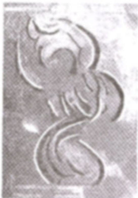
ภาพที่ 11 แสดงการจัดองค์ประกอบศิลป์

เป็นภาพของรูปร่างมนุษย์ (Human Figure) ที่แทนพระเจ้าซึ่งกำลังอยู่ในอาการยกมือทั้งสอง ขึ้นเหนือศีรษะและกำลังหันพระพักตร์ไปทางด้านความมืด