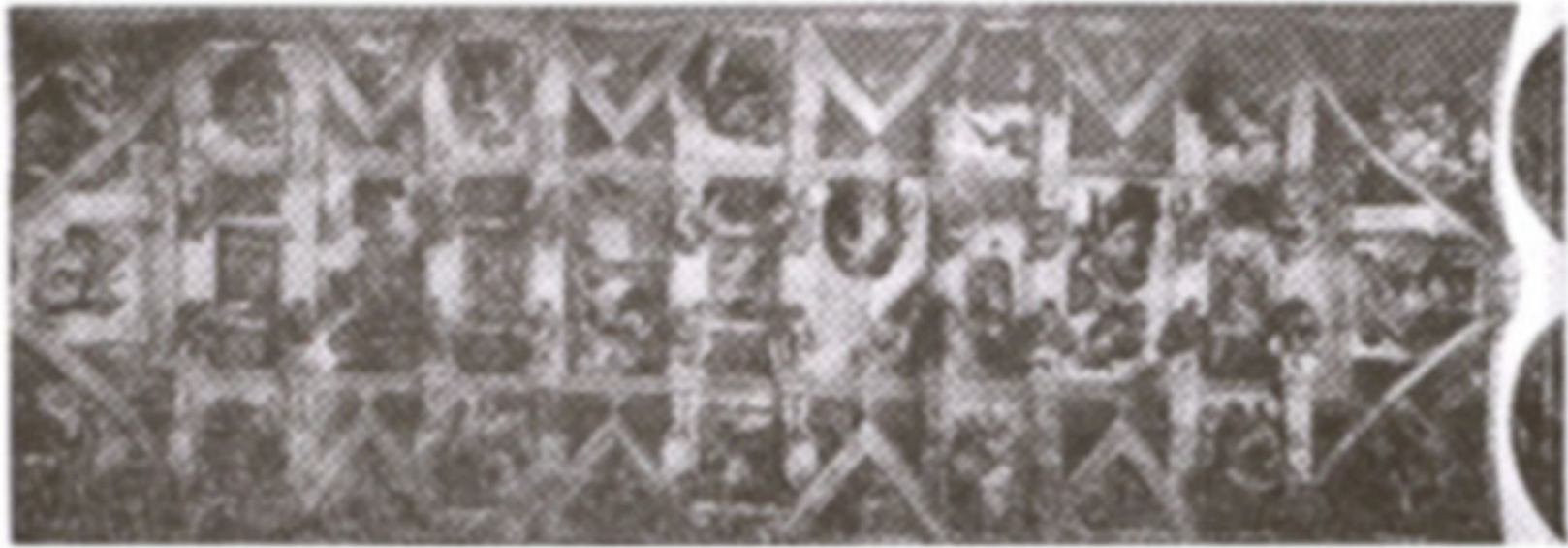
ภาพที่ 4 การออกแบบเรื่องราวและรูปแบบ