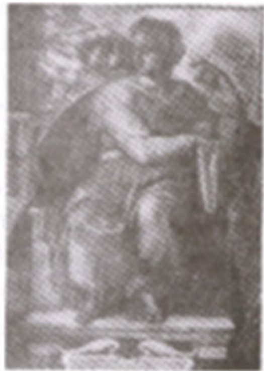
ข. อีสไซอาห์