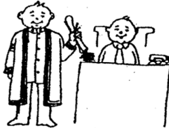
รับปริญญา