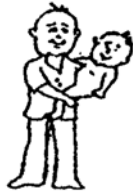
เลี้ยงลูก