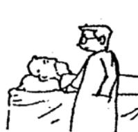
เจ็บป่วย