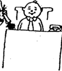
เข้าทำงาน