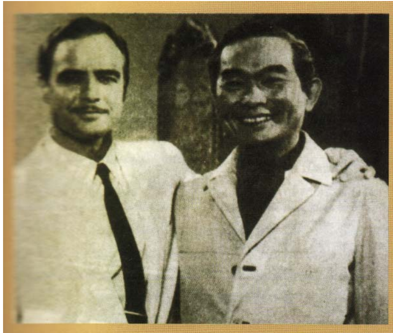
ภาพถ่ายมาร์ลอน แบรนโด (ซ้าย) และพลตรี หม่อมราชวงศ์ คึกฤทธิ์ (ขวา)