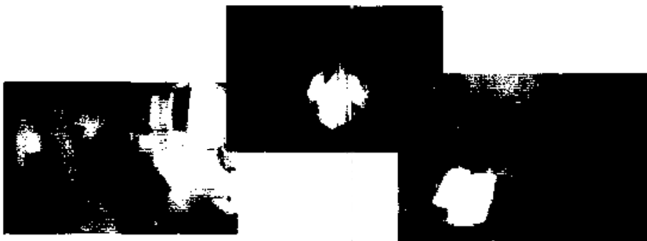
การบริการตนเองของ มอ.สุราษฎร์ธานี

จุดแรกที่จะนำชมก็คือ การบริการยืม-คืนด้วยตนเอง โดยเราได้ประยุกต์ใช้เครื่องยืม-คืนอัตโนมัติของต่างประเทศที่มีราคาหลักล้านมาเป็นเครื่องคอมพิวเตอร์ธรรมดา เครื่องอ่านบาร์โค้ด และเครื่องพิมพ์สลิปสำหรับรายงานผลแทนการประทับตรา ซึ่งเมื่อจัดให้มีบริการนี้เราได้จัดการสั่งซื้อ-จัดพิมพ์ของบัตรหนังสือ บัตรหนังสือ และมีครกำหนดส่ง งดการประทับตรากำหนดส่ง ประหยัดงบประมาณและลดแรงงานไปได้มากทีเดียวค่ะ