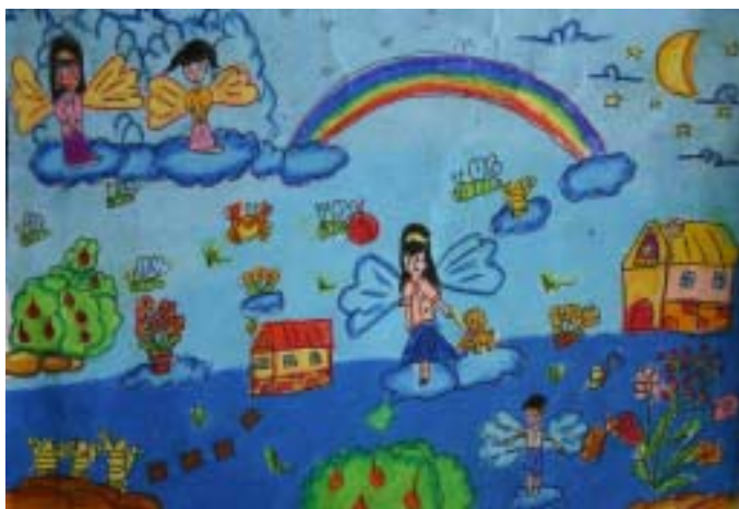
เด็กหญิงภาวิณี มณียม ระดับชั้นประถมศึกษาปีที่ ๓ โรงเรียนอนุบาลสาธิต ม.อ. ปัตตานี ได้รับรางวัล ดีเด่น หัวข้อ เมืองมหัศจรรย์