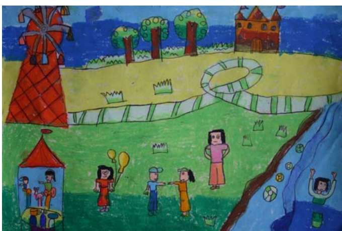
เด็กหญิงธัญชา ดินดีวรเดช ระดับชั้นประถมศึกษาปีที่ ๑ โรงเรียนอนุบาลยะลา ได้รับรางวัล ดีเด่น หัวข้อ สวรรค์บนดิน