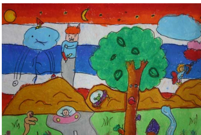
เด็กชายภีมพล ลิฬหาวงศ์ ระดับชั้นประถมศึกษาปีที่ ๓ โรงเรียนอนุบาลสาธิต ม.อ. ปัตตานี ได้รับรางวัล ชมเชย หัวข้อ เมืองมหัศจรรย์