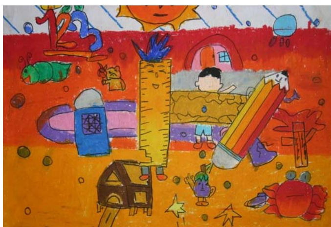
เด็กหญิงศุภมาส ก่อเกียรติพิทักษ์ ระดับชั้นประถมศึกษาปีที่ ๓ โรงเรียนอนุบาลสาธิต ม.อ. ปัตตานี ได้รับรางวัล สร้างสรรค์ หัวข้อ เมืองมหัศจรรย์