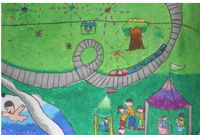
เด็กหญิงกุลจิรา จรัสภิญโญวงศ์ ระดับชั้นประถมศึกษาปีที่ ๑ โรงเรียนอนุบาลยะลา ได้รับรางวัล ยอดเยี่ยม หัวข้อ สวรรค์บนดิน