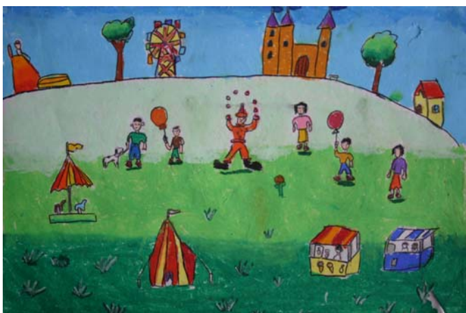
เด็กชายศิวกร แสงคงทอง ระดับชั้นประถมศึกษาปีที่ ๑ โรงเรียนอนุบาลยะลา ได้รับรางวัล สร้างสรรค์ หัวข้อ สวรรค์บนดิน