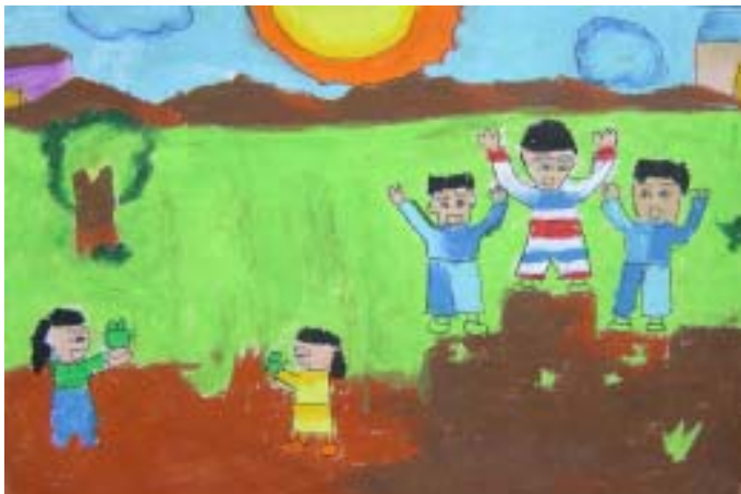
เด็กชายอานัส กรุณามัยวงศ์ ระดับชั้นประถมศึกษาปีที่ ๑ โรงเรียนแหลมทองอุปถัมภ์ ได้รับรางวัล สร้างสรรค์ หัวข้อ ของขวัญวันเด็ก