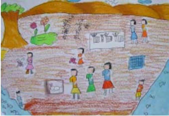
เด็กหญิงเจ๊ะอัสมี เบญจมะ ระดับชั้นประถมศึกษาปีที่ ๑ โรงเรียนแหลมทองอุปถัมภ์ ได้รับรางวัลชมเชย หัวข้อ ของขวัญวันเด็ก