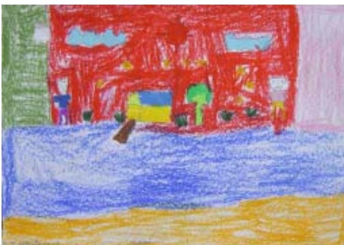
เด็กชายมุฮัมมัดสะกรี บาซอ ระดับชั้นประถมศึกษาปีที่ ๑ โรงเรียนเมืองปัตตานี ได้รับรางวัล ชมเชย หัวข้อ ของขวัญวันเด็ก