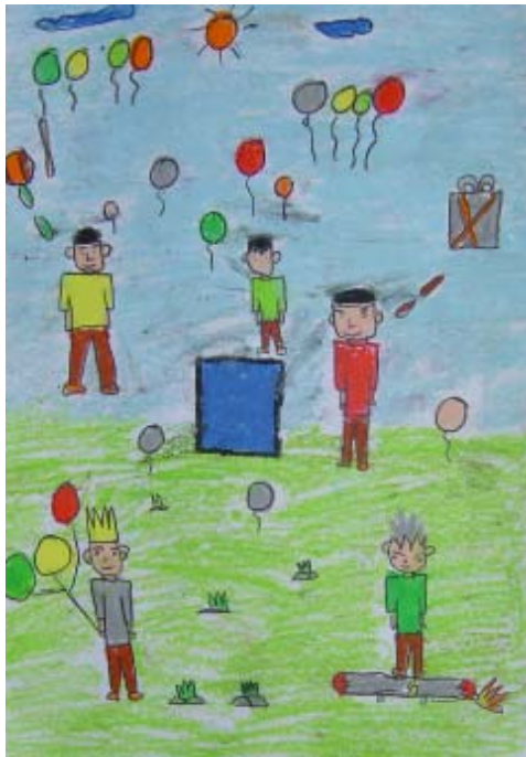
เด็กชายศุภวิชญ์ หวานจิตต์ ระดับชั้นประถมศึกษาปีที่ ๑ โรงเรียนอนุบาลสาธิต ม.อ. ปัตตานี ได้รับรางวัล ชมเชย หัวข้อ ของขวัญวันเด็ก