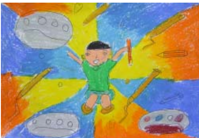
เด็กชายปิยมน์ัส ชุณหภากร ระดับชั้นประถมศึกษาปีที่ ๑ โรงเรียนเจริญศรีศึกษา ได้รับรางวัล สร้างสรรค์ หัวข้อ ของขวัญวันเด็ก