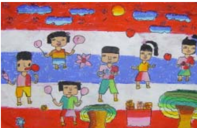
เด็กหญิงพรรณภักตร์ นวลคง ระดับชั้นประถมศึกษาปีที่ ๒ โรงเรียนแหลมทองอุปถัมภ์ ได้รับรางวัล ยอดเยี่ยม หัวข้อ ของขวัญวันเด็ก