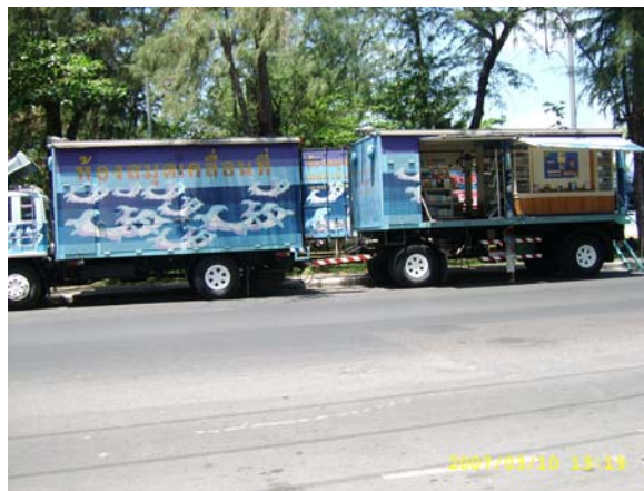
รถห้องสมุดชายหาดเคลื่อนที่เทศบาลนครสงขลา

เมื่อทดสอบความแตกต่างโดยการเปรียบเทียบค่าเฉลี่ยรายคู่ด้วยวิธีของ LSD พบว่า ผู้ใช้บริการห้องสมุดชายหาดเคลื่อนที่ เทศบาลนครสงขลา ที่เป็นนักเรียน/นักศึกษา มีความพึงพอใจมากกว่ากลุ่มรับราชการ/รัฐวิสาหกิจและกลุ่มรับราชการ/รัฐวิสาหกิจมีความพึงพอใจน้อยกว่ากลุ่มเกษตรกร/ประมงและกลุ่มรับราชการ/รัฐวิสาหกิจมีความพึงพอใจน้อยกว่ากลุ่มประกอบอาชีพอิสระ/ค้าขาย