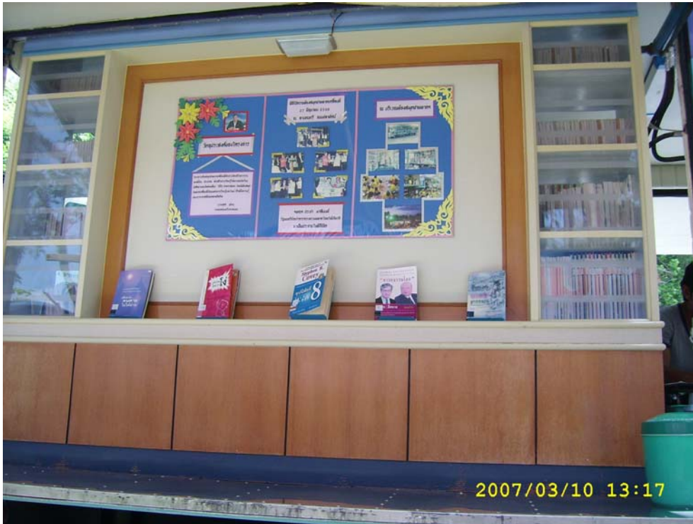
ส่วนจัดแสดงหนังสือภายในรถห้องสมุดชายหาดเคลื่อนที่ เทศบาลนครสงขลา