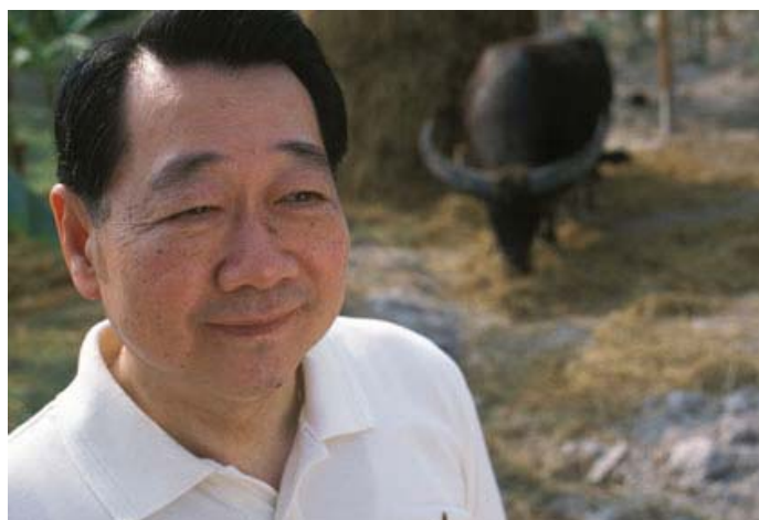
รูปแสดง ธนินทร์ เจียรวานนท์ มหาเศรษฐีอันดับที่ 317 ของโลก

รูปแสดง มหาเศรษฐีของโลกที่ทำธุรกิจไอที http://www.forbes.com