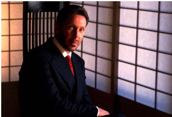
Lawrence Ellison (อันดับที่ 15)