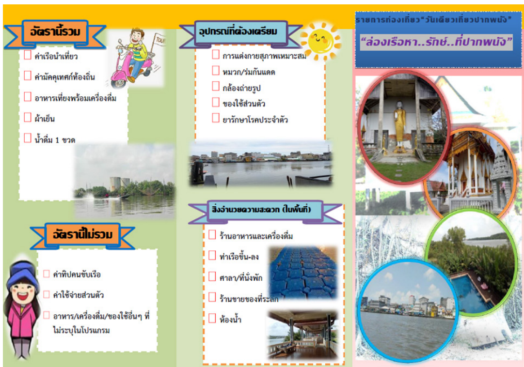
(ข-ด้านหลังแผ่นพับ)