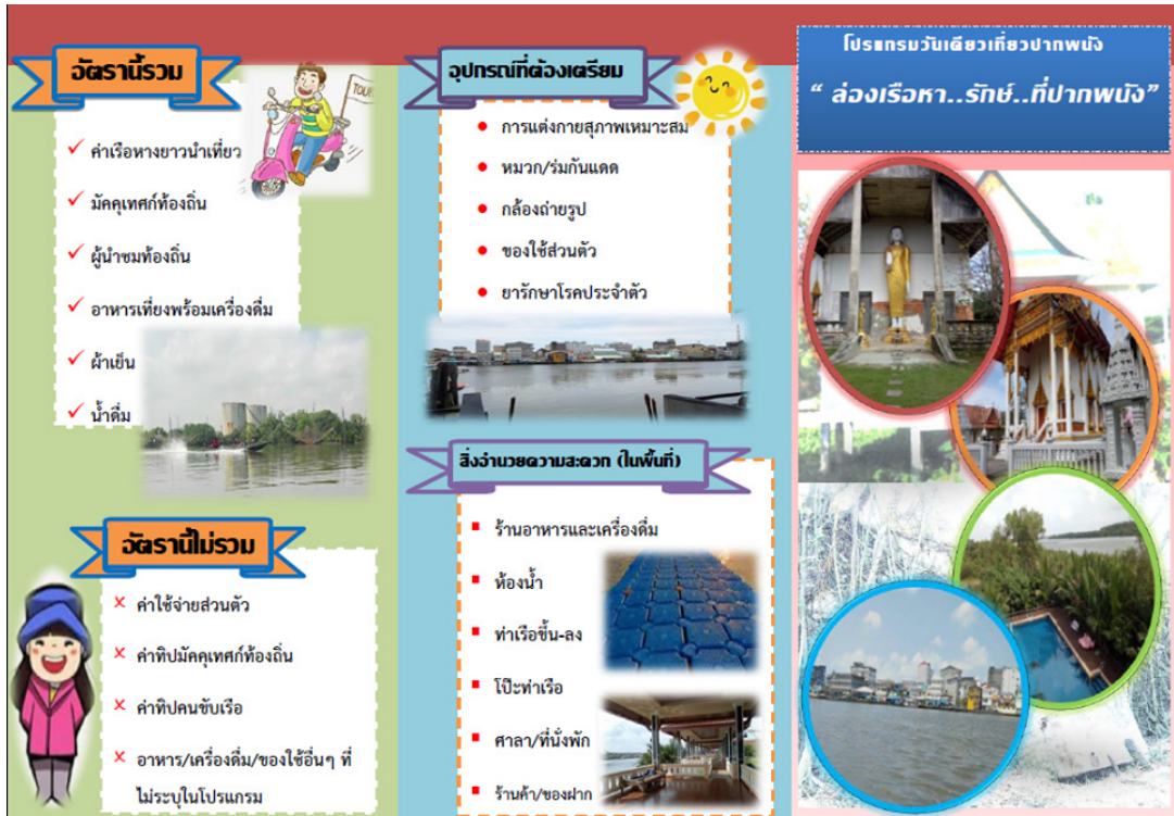
(ข-ด้านหลังแผ่นพับ)

ภาพที่ 10 (ก, ข) แผ่นพับประชาสัมพันธ์เส้นทางท่องเที่ยว “ล่องเรือหา...รักษ ที่ปากพนัง” ด้านหน้าและด้านหลัง